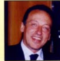
Luigi VERDECCHIA Prefetto